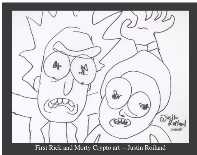
First Rick and Morty Crypto art -- Justin Roiland